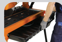
Bac à eau amovible