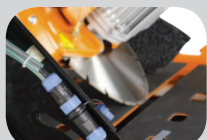
Coupe biseau 45°