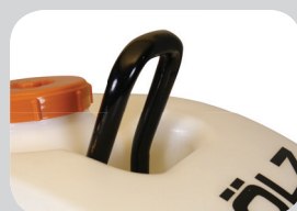
Crochet de levage