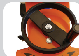
Plongée par volant