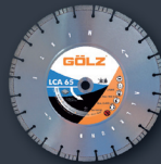
LCA 65 Mixte