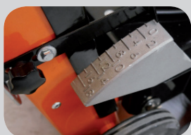
Indicateur de la profondeur de coupe