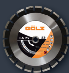
LA 75 Asphalte