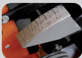
Indicateur de profondeur de coupe