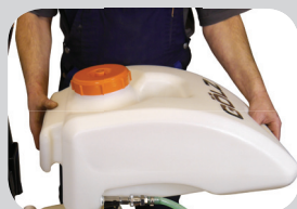
Bac à eau amovible crochet de levage