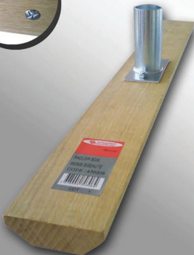
Modèle biseauté 2 faces réf. 47 03 06