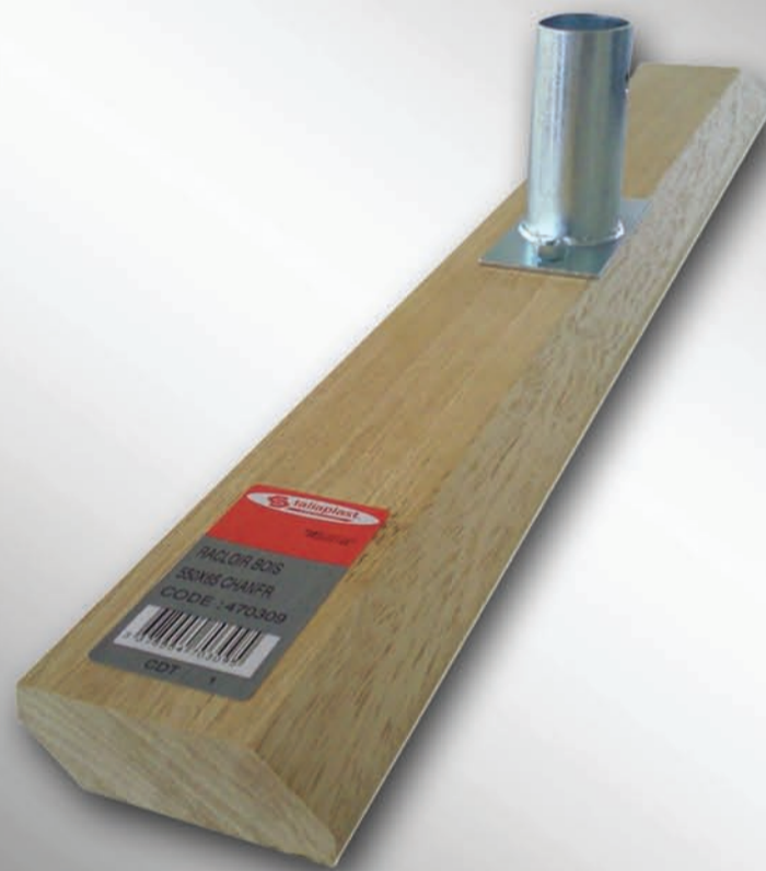
Modèle 2 angles chanfreinés réf. 47 03 09