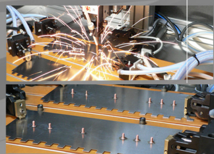
site de production Taliaplast

Une dent dans chaque angle (évite la colle dans les angles rentrants)