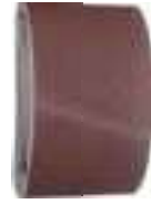
200 x 480 Voir PAGE 58