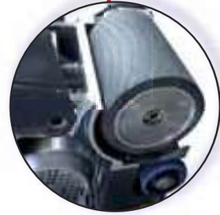
ROULEAU À EXPANSION CENTRIFUGE