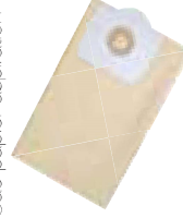
Réf. 001 955