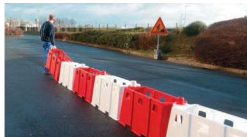
Pas : 1.20m soit 833 séparateurs par kilomètre

Passage pour emboiture tube 40 x 40 mm, avec couvercle en Option