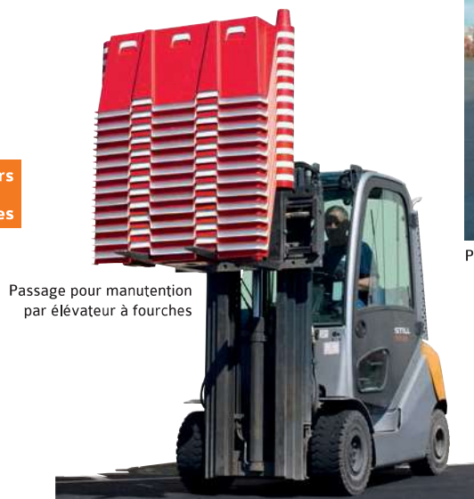
Passage pour manutention par élévateur à fourches