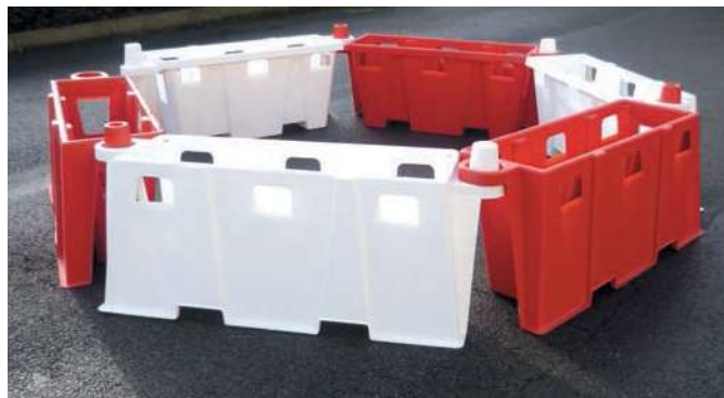
Giratoire Ø minimum 3,20 m (7 séparateurs)