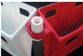
Verrouillage pour traction d'une longueur de plusieurs séparateurs