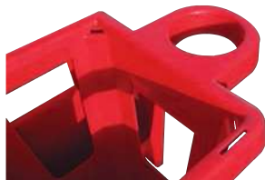
Poignée de traction