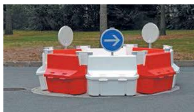
Giratoire + B21 Type EUROP Ø 4,50 m Diamètre minimum 3,30 m

Jusqu'à 25 Séparateurs et connecteurs par palette !