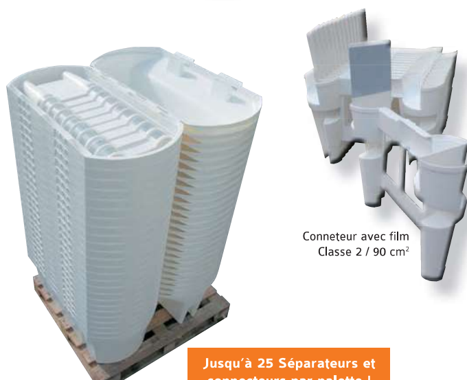
Connecteur avec film Classe 2 / 90 cm 2

Jusqu'à 25 Séparateurs et connecteurs par palette !