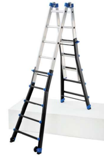
S'utilise en rattrapage de niveau dans les escaliers