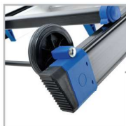
Roulettes de déplacement Patins bi-matériaux sur modèles AL065 / AL070 / AL075