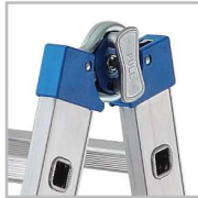
Articulation automatique acier ultra résistante

Echelle multifonctions télescopique - Verrouillage de l'articulation renforcée et automatique - Roulettes de déplacement