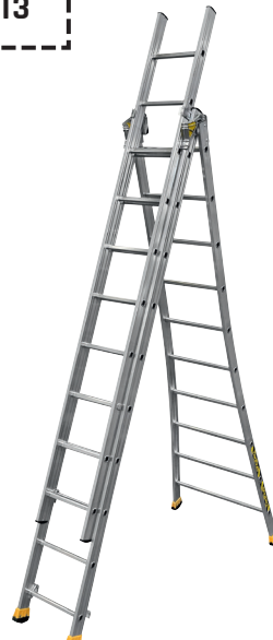
POSITION AUTOSTABLE AERIENNE