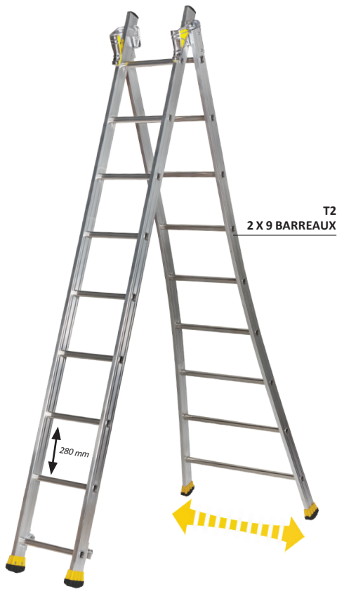
T2 2 X 9 BARREAUX