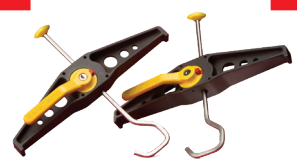
ATTACHE-ÉCHELLES POUR GALERIE DE TOIT Code 380395