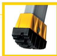
Patins chaussants antiglissement et antidérapage.