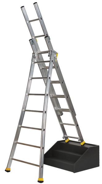
POSITION EN DÉNIVELÉS

3 ÈME PLAN DÉTACHABLE JUSQU'À 2 x 10 ET 3 x 10 BARREAUX