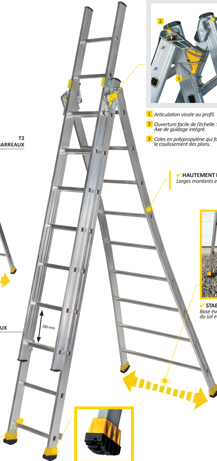
T3 3 X 9 BARREAUX

✓ HAUTEMENT RÉISTANTE ! Larges montants en aluminium striés.