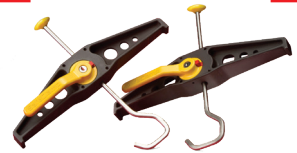
ATTACHE-ÉCHELLES POUR GALERIE DE TOIT Code 380395