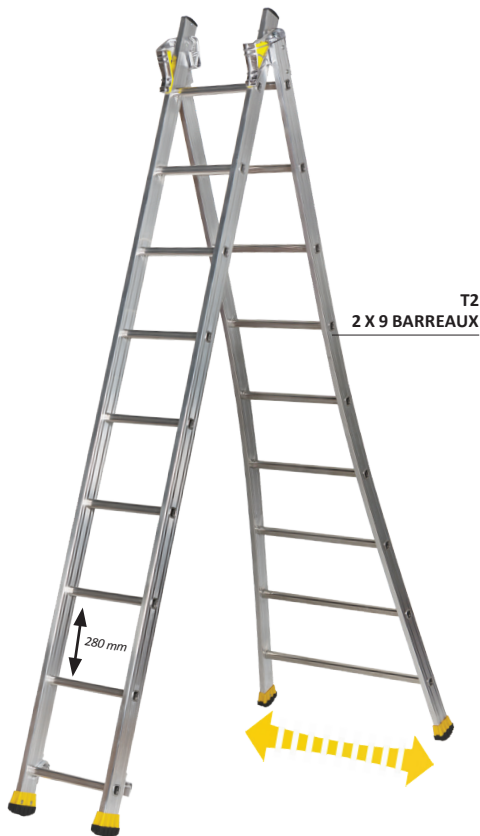
T2 2 X 9 BARREAUX