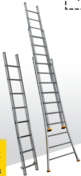
POSITION ÉCHELLE SIMPLE