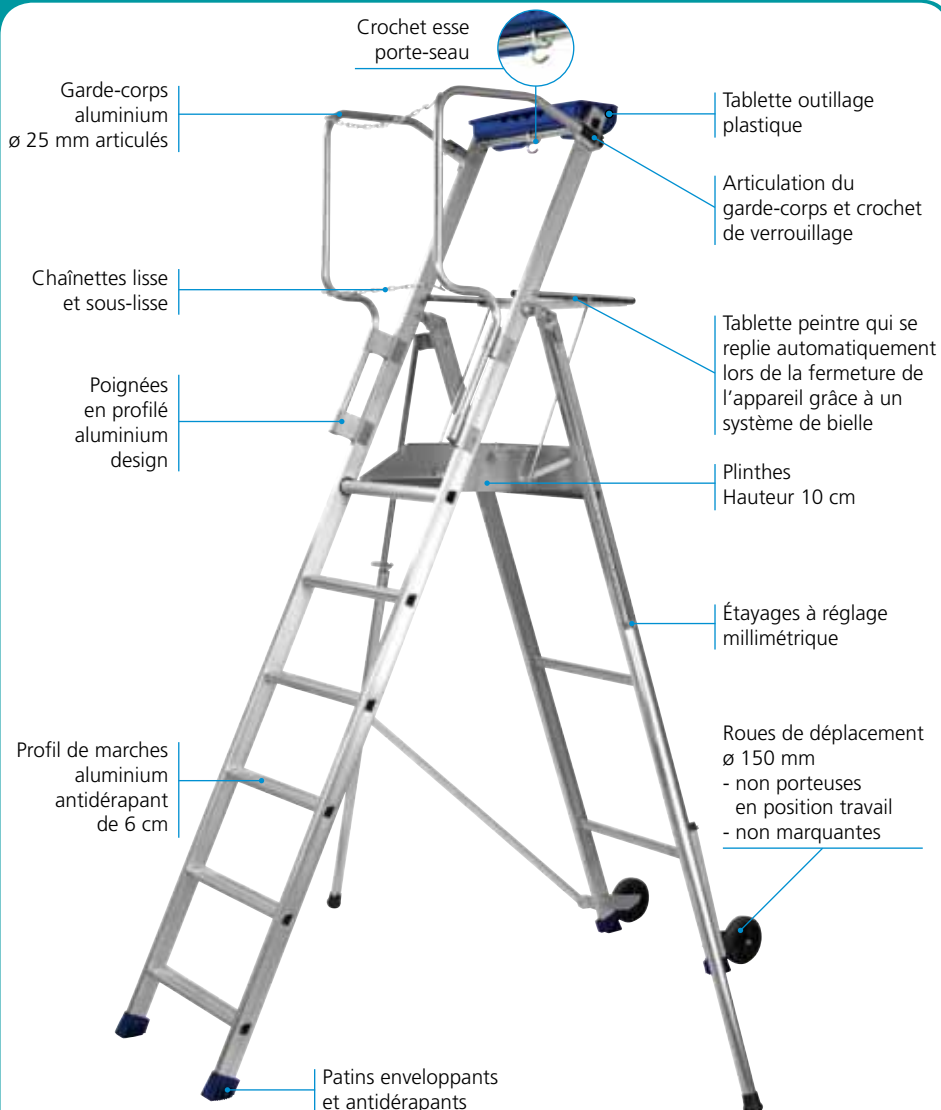
F6 hauteur de travail 3,45 m