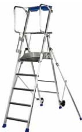
F5 hauteur de travail 3,20 m