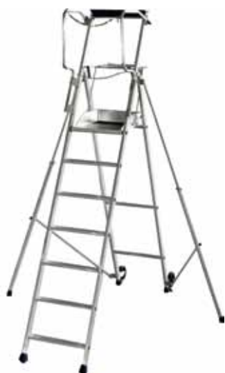
F7 hauteur de travail 3,70 m