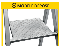
PLATE-FORME DE TRAVAIL ANTIDÉRAPANTE en fonte d'aluminium. Dimensions 250 X 250 mm.

Articulation haute résistance en fonte d'aluminium qui enveloppent le profil arrière.