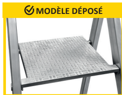
PLATE-FORME DE TRAVAIL ANTIDÉRAPANTE en fonte d'aluminium. Dimensions 250 X 250 mm.

Articulation haute résistance en fonte d'aluminium qui enveloppent le profil arrière.